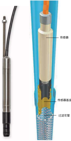
用于安装管的压力传感器及连接 器