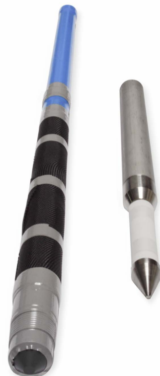
HPVC连接管 (左)和透水过滤器 (右)