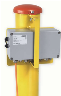
系统管口保护及数据采集 设备